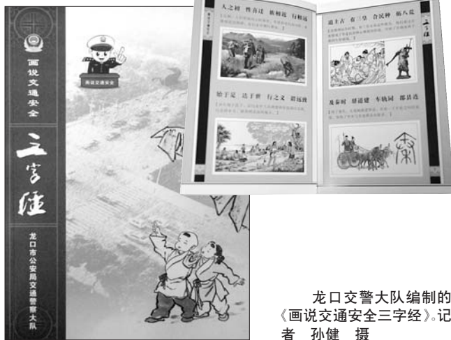
龙口交警大队编制的《画说交通安全三字经》。

《画说交通安全三字经》编写完成之后,大队安排民警在辖区各所小学进行了试讲。在课堂上,老师充分发挥情景教育模式的参与性,与他们交流问答,互动游戏,带领小学生们学习道路交通安全知识,教学气氛热烈,课堂生动活泼,极大地提高了小学生的学习积极性。