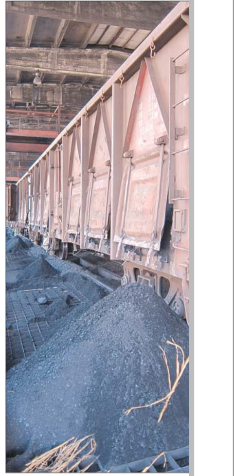
截至10月底,黄台电厂储煤已达到25万吨,如今仍有运煤列车源源不断开进厂区卸煤。

本报11月1日讯(记者 王光照 王光普 赵丽 见习记者 陈燕)“省城最大热源厂”黄台电厂储煤已达25万吨,为历年同期最高,可供4台机组烧20余天。1日,黄台电厂相关负责人说。黄台电厂约占济南集中供热面积的30%,主要为东部城区供暖提供热源,该热源厂储煤充足,意味着今冬东部城区供暖有了保障。 1日,记者在黄台电厂看到,厂区内共有4个储煤场,其中3个露天煤场已煤山高耸,另一个容量为10万吨的煤场也已存满煤炭。“我们从9月份开始加大储煤力度,截止到10月底,储存已达25万吨,可供4台机组用20余天。”黄台电厂相关负责人介绍,这样的储煤量为历年同期最高。现在送煤的列车源源不断地开进厂区,今年的储煤情况比去年好很多。