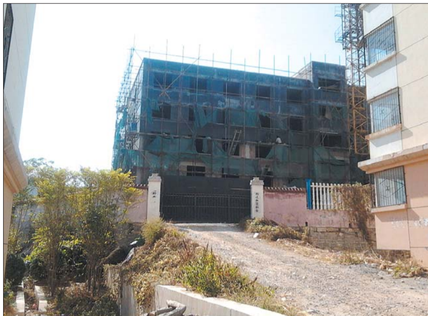
长清区乐天小区一区8号楼南侧的一处在建老年公寓至今未办理审批手续,属于违章建筑,但是仍在施工。

近日,长清乐天小区居民向本报反映,一区8号楼南侧有一老年公寓属于违章建筑,严重影响了8号楼的采光,希望相关部门进行查处。事情真相到底如何呢?10月31日,记者来到长清区乐天小区进行了采访。