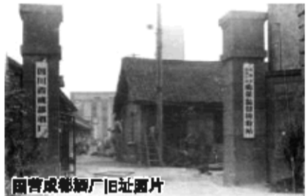
国营成都酒厂旧址照片