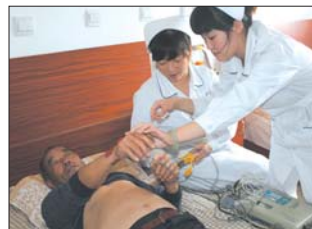
▲医院义工为老人义诊。

篮子,也锻炼了老人们的身心。“老人们热情很高,现在‘开心农场’已经接近7亩了。”魏部长说,前段时间评选“十佳老人”时,还对生产队上劳动积极的老人给了奖励。