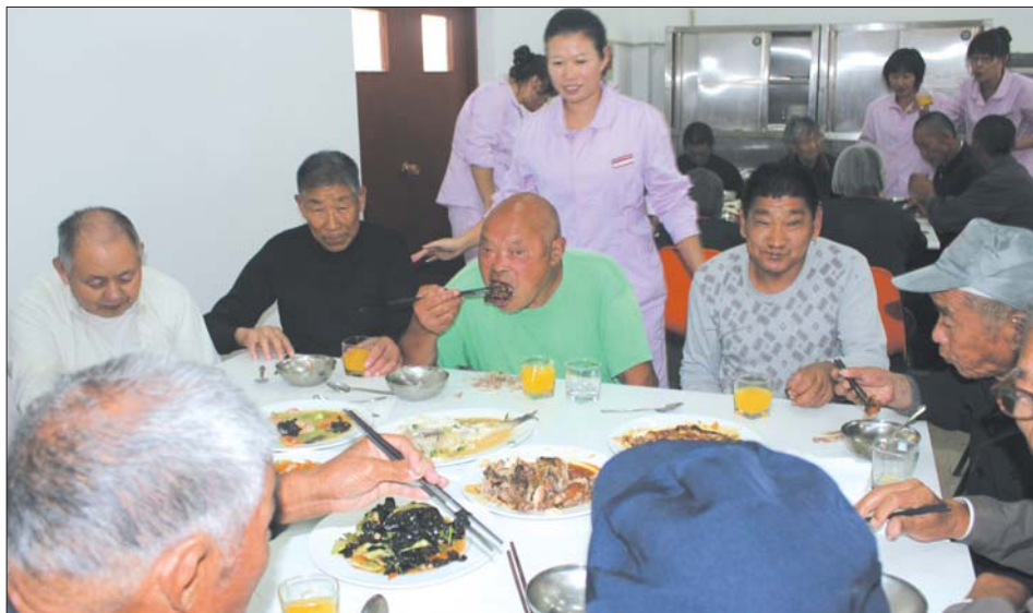
中秋节老人聚餐。

“该托养院建成后,将成为全市规模最大、设施最先进的残疾人托养院。”邢凤田说,“后续的三期工程将建立收容所,儿童福利院等项目,四期工程将引入社会资本运作,建设面向全社会的养老公寓。”开发区社会福利中心将成为集敬老院、光荣院、救助站、流浪未成年人救助保护中心、城镇“三无”老人(儿童)福利院、残疾人康复中心为一体的福利中心。