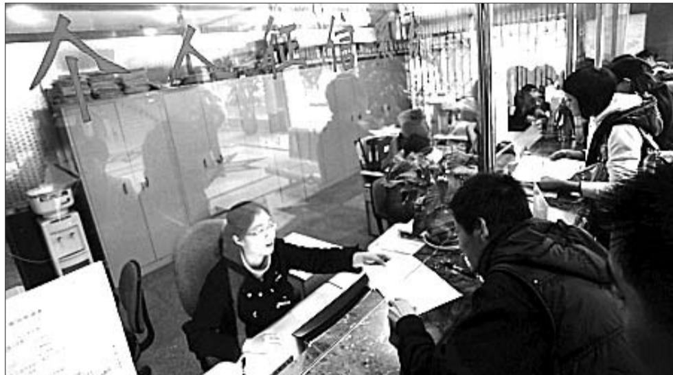
市民在银行征信系统查询柜台前咨询相关信息。(资料片)

中国人民银行征信中心客服人员表示,新版信用报告将逾期信息的起计时点定于2009年10