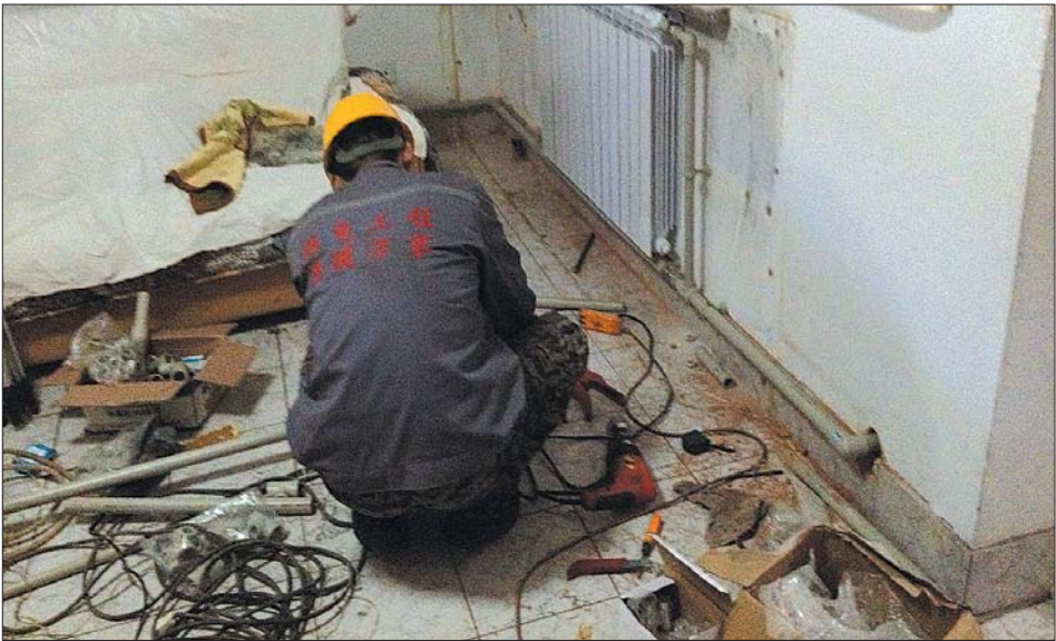
►市中区人民法院南宿舍,热电施工人员刚刚拆卸更换完客厅暖气片。

正在实施供热系统优化,像即将完工、今年就能投入使用的祝舜路隔压站及配套汽改水工程,能在一定程度上弥补东部地区的供热缺口。黄台电厂7、8号机组每年都满负荷运行,负责东部老城区供暖。9、10号机组按照主管道走向,主要负责的是龙奥等东部新城区,通过该隔压站,可将一部分结余热源送到部分二环东路以西的老城区,解决一些老片区的供热问题。“以后需要道路改造时供热管网以及换热站同步建设,才能使黄台电厂的剩余热源得到高效利用。”黄台电厂相关人士说。