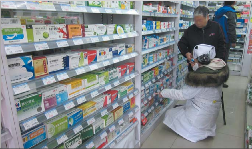
在药店货架前，不少物美价廉的药品得蹲着取。

本报11月5日讯(记者 王茂林)“去药店买药不想被坑就得蹲下来!”近日,“药店潜规则”一事在网上风传:药店把贵药摆在显眼位置,热情推销,而把物美价廉的药品摆放在货架底层,甚至“藏”起来,引起网友表示愤慨。记者调查发现,此类现象在一些药店确实存在,但并非普遍现象。 记者走访省城多家药店发现,“药店潜规则”确实存在。5日上午,在文化西路一家连锁药店,一名女士前来购买“清开灵”,销售人员二话没说便给这位女士从感冒药货架上取下了售价20元左右的产品,而记者注意到,对于底下两层摆放的不同包装但便宜5块钱左右的产品,销售人员并未推荐。另一位购买“强力枇杷膏”的女士也遇到了类似的情形,销售人员直接向她推荐25元多的药品,而记者看到同一品种另一包装的“强力枇杷膏”价格为16块多,不过被放在同排较为“偏僻”的位置。 “你看我们家最便宜的药还放