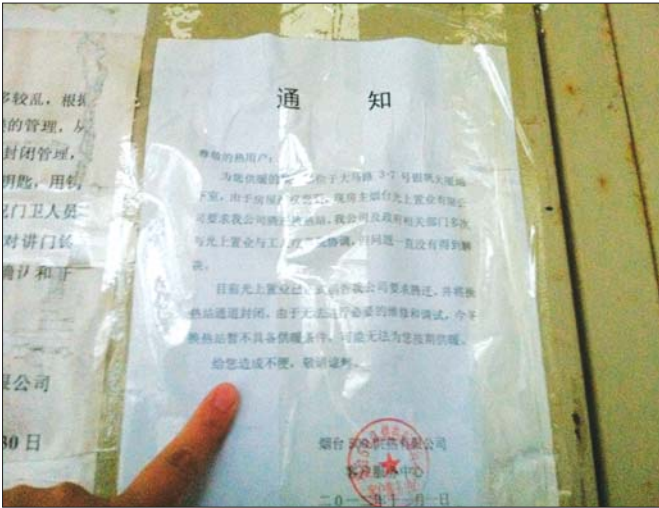
换热站楼上也贴出了可能无法供暖的通知。

一场秋雨一场寒,当市区大部分市民都在安心等待集中供暖时,大马路片区的部分居民却被一纸通知弄得慌了手脚。因500供热公司航院班工疗换热站产权变更,新接手的光上置业要求腾迁换热站,50多个单元的居民今冬可能面临没法正常供暖的窘境。