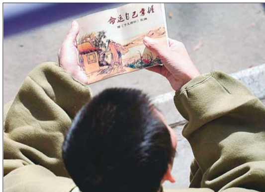
1日,济南市救助站,一名精神障碍流浪者拿着本名为《命运自己掌握》的书。

“绝大部分寻亲网站刊登的都是寻人启事,其实更重要的是刊登走失人员的信息,因为了解走失人员情况的市民或机构很少会去这些网站。”济南市救助站站长王子福说,另外,在走失人员较多的农村地区,上网仍是问题,救助站可以通过电视、网络提供信息。