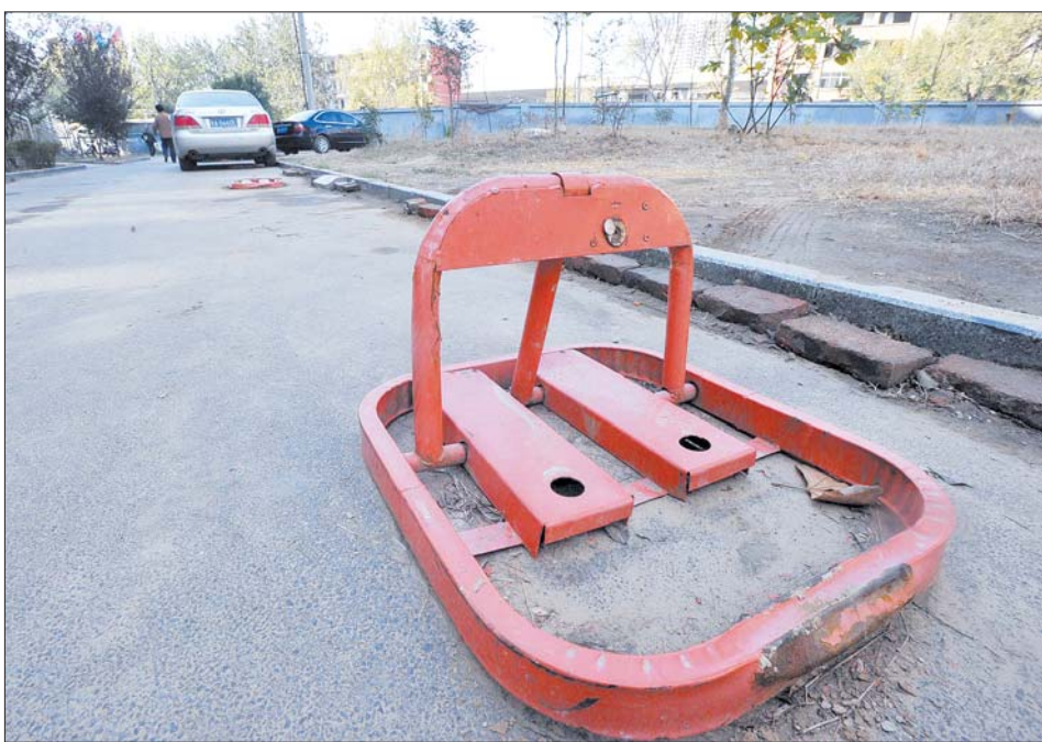
▲11月6日,在济南金色港湾小区内,消防通道被安装上了停车的车位锁,引起小区居民不满。

物业擅自把消防通道改成停车位,私自上锁强行收费,未经业主同意安装蓝牙门禁卡系统,导致多数业主车进不了小区,小区电梯坏了五十多天迟迟无法维修……6日,济南市房管、物价联合督察物业服务收费活动的第二天,对历城区金色港湾小区存在的问题进行了查处。