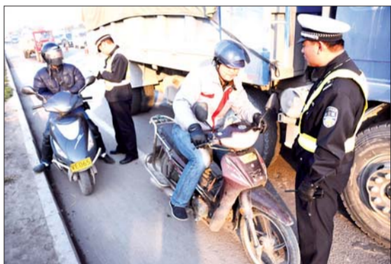
民警对在机动车道内行驶的助力车进行查处。

在半个小时的检查中,交警共查处了6起骑车在机动车道行驶的违章者,并均开出了罚单,同时还有多辆电动车被查。因电动车数量较多,民警只是对驾驶员作出了警告,并教育他们不得再驶入机动车道。下一步,民警也将对骑电动车进入机动车道的行为进行罚款。