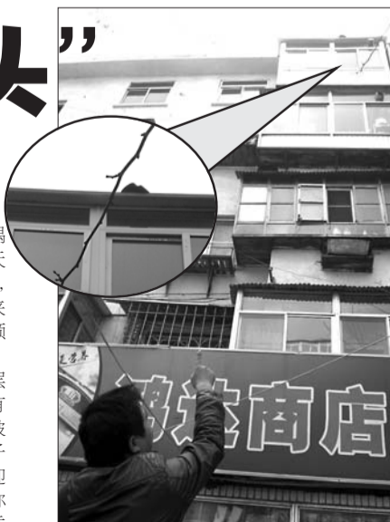
楼顶伸出的石块正对一家商店。

记者在该居民楼的5层楼梯口看到,楼梯口上方有通往楼顶的通道,但通道被盖子封闭,下方也没有梯子可以上去。记者随后来到迎西社区居委会,工作人员称已经到该楼了解情况,居委会将尽快消除该楼的安全隐患。