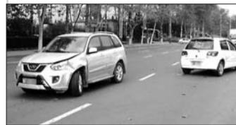
威志和奇瑞一个朝南一个朝北,停在南行的车道上。