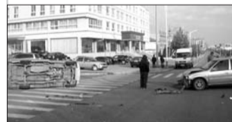
吉利轿车前部受损严重,面包车侧翻在地。