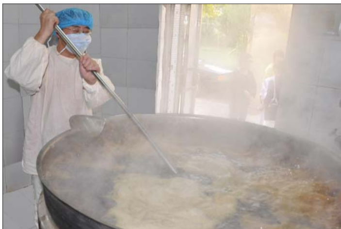
医院工人正在煎熬中药,市民对中医进补越来越重视。

“膏方的服用时间较长,所以制定膏方需要有针对性,即一人一方。”魏陵博提醒,这样才能达到增强体质,祛病延年的目的。另外,膏方中含有补益气的药物,这些药物黏腻难化,不顾实际情况盲目进补,对健康反倒没有益处。