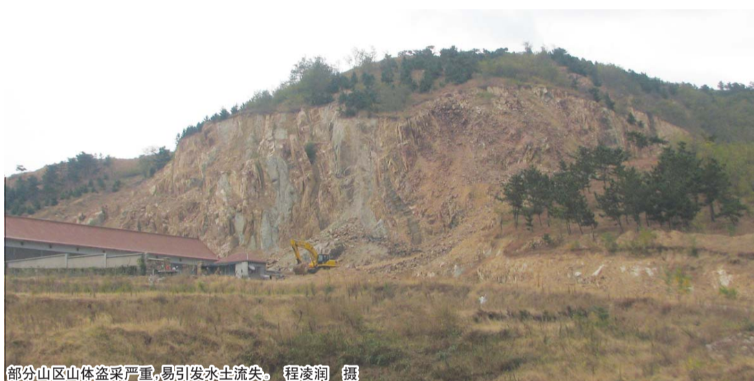
部分山区山体盗采严重,易引发水土流失。程凌润 摄

“四道防线”是综合治理小流域的有效方法,分别在山顶、山腰、山脚、山沟栽种合适的植被,在山顶种树(乔、灌木)种草覆盖,可减缓坡面径流流速,增加土壤入渗;在山间坡度较缓部位修建果树梯田,栽种经济果林,改变微地形,一方面拦截山顶来的径流,另一方面拦蓄本身所承接的降雨,满足经济果林生长需要;在山脚修建水平梯田,作为基本农田种植农作物;在山沟修建塘坝,拦蓄山坡分散的径流,从而起到灌溉和防洪的作用。