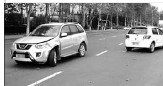
威志和奇瑞一个朝南一个朝北,停在南行的车道上。