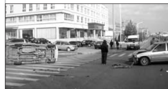
吉利轿车前部受损严重,面包车侧翻在地。