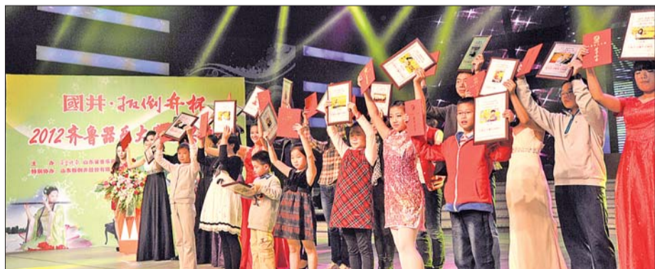
▲获奖选手领奖。

为丰富青少年文化生活,打造齐鲁演奏新星而举办的此项大赛,立足音乐文化积淀深厚的齐鲁大地,面向全国专业演奏员、专业院校学生和业余音乐爱好者。大赛自7月初启动,立即引起广大读者特别是青少年朋友的广泛关注。8月中旬,先进行了少年、儿童、幼儿组的比赛,9月中旬,又成功进行了青年键盘乐组、青年管弦乐组和青年教师组的初赛和决赛。经过省音乐界、音乐教育界、演艺界专家组成的评委会公开、公正、公平的评判,先后评出各组别的一、二、三等奖。在10月28日举行的电视颁奖晚会上,部分获奖选手一展风采,表演了各自的拿手节目。