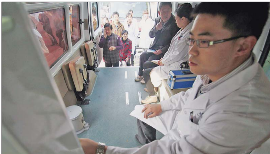
施尔明眼科医院专家在为社区居民进行检查。

本报11月8日讯(见习记者 许建立 蒋龙龙 肖龙凤) 11月8日上午,张刚大篷车联合山东中医药附属眼科医院(施尔明眼科医院)走进天桥黄台社区,推出“爱眼护眼进社区”活动,为47位社区居民进行眼膜、眼底等各项眼睛健康检查。