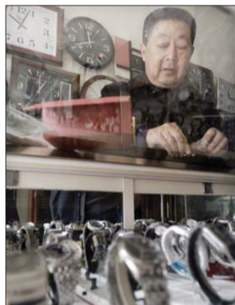
老孔店里有各式手表和时钟。