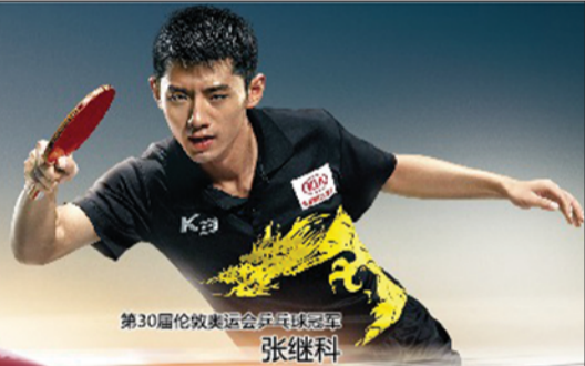
第30届伦敦奥运会乒乓球冠军 张继科