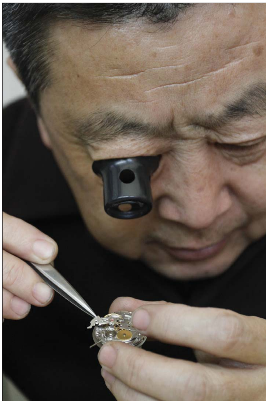
有的手表零件太小,老孔要戴上三倍放大镜来修理。