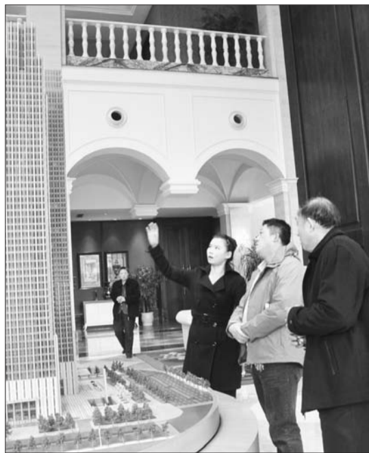
在青岛中心项目售楼处,销售人员正在向两位有投资意向的看房者介绍楼盘情况。

在看完青岛中心项目后,10日下午,看房者又来到胶南,分别看了月亮湾项目和万科·青岛小镇项目。虽然一整天都在下雨,但看房者的兴致都非常高。