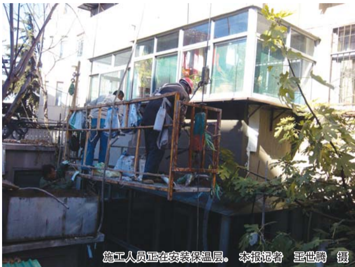
施工人员正在安装保温层。

水,冷运后转入供热正常运行。受部分市民延期缴费或更换暖气片的影响,延误正常注水,造成整个系统平衡发生波动,影响热水的正常循环,使暖气不稳定、忽冷忽