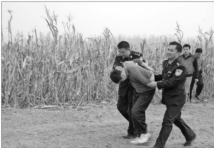
警民联手,窃贼很快被擒。

据民警介绍,该男子马某23岁,当天中午,他从附近居住的地方出来踩点,来到楚庄村时,发现村民杜某家大门用一把明锁锁着,马某看了看周围没有人,于是撬门而入实施盗窃,被发现后他立即爬上墙头逃跑,但他没想到村民和民警行动都如此迅速。