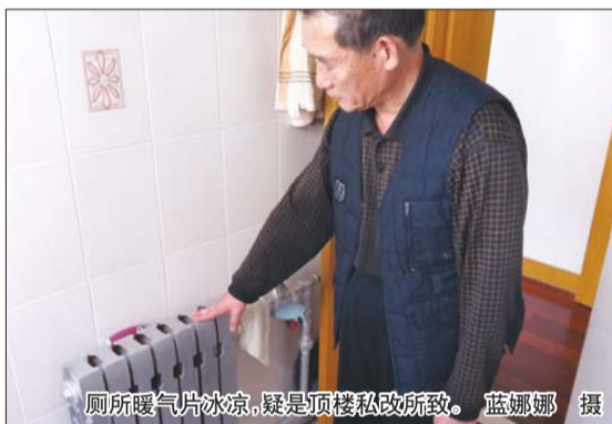
厕所暖气片冰凉,疑是顶楼私改所致。

于先生称,去年发现卫生间暖气片不热后,他和同单元的邻居便向负责小区供热的换热站联系,换热站工作人员也很配合,很快到顶楼居民家中维修,但不知是