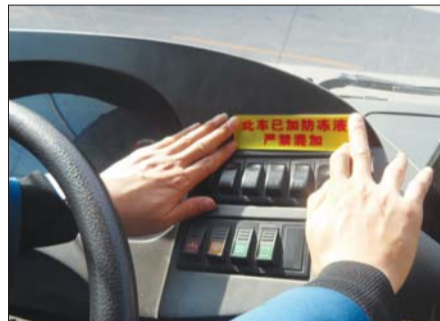
公交车“喝”上防冻液。

在安全运行方面,公司所属各路队、保修厂均成立了冬运突击队,120名突击队员随时待命,24小时保持通讯畅通,一旦下雪将迅速集结到危险路段清理积雪、为车辆挂防滑链条。目前,二分公司已准备了270条编织袋、6吨防滑沙、862根链条、3吨融雪剂、49个推雪板、15部应急车辆和731床棉被等冬运物资,以备应急之需。