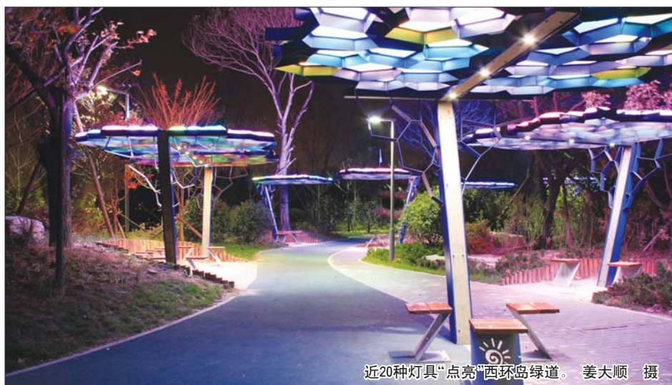
近20种灯具“点亮”西环岛绿道。

近日,近20种彩灯点亮了西环岛绿道,亮化灯以LED节能灯为主,打造出明暗对比强烈、色彩变化丰富的夜晚景观,满足居民夜间道路交通、林下休闲等需要。据了解,西环岛绿道工程位于唐岛湾南岸公园至银沙滩路之间,长约3800米,占地约14万平方米。工程计划总投资1.23亿元,打造以满足自行车、步行等游览功能为主,兼顾电瓶车及管理车辆通行的“慢行交通景观体系”。绿化设计以杨树、柳树、槐树等乡土树种为主,合理搭配枫香、乌桕、银杏等色叶植物,形成层次丰富的绿化景观效果。