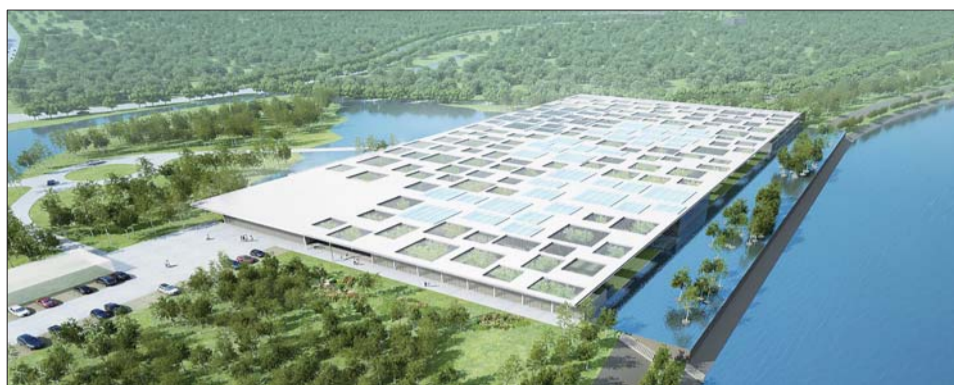
白鹭湾水云间会所鸟瞰图