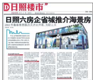
▲2012年4月8日,本报D01版报道6家房企赴济南宣传海景房。