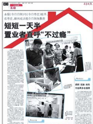
▲2012年8月21日,本报C08版报道本报《今日日照》与《今日枣庄》联手,在枣庄和滕州推介日照海景房。