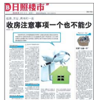
▲2012年9月5日,每周一期的日照楼市的报道主题是,提醒市民关注收房时的注意事项。