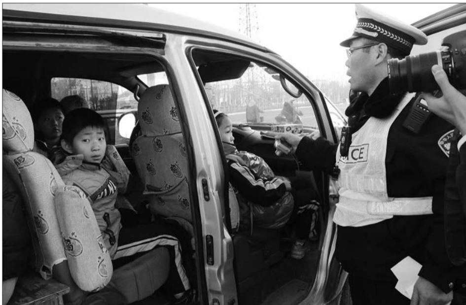
学生的面包车进行检查。

本报11月14日讯(记者 刘涛 通讯员 马兆磊) 近期,个别私家车主为谋求私利,改装车辆接送学生,存在超员超载现象,对学生生命安全造成威胁。14日,滨州市公安交警支队西城区大队对辖区中小学、幼儿园接送车辆进行检查,共查处黑校车六辆。