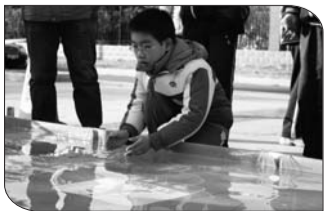
“杭州号”驱逐舰比赛现场。