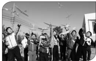
天驰橡皮筋飞机比赛现场。