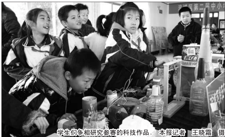
学生们争相研究参赛的科技作品。

据了解,活动由滨城区教育局主办,以“科技创新”为主题,旨在倡导学生崇尚科学,激发学生学习科学兴趣,引导学生实践体验身边的科学知识,让学生在“在实践中体验,在体验中创新,在创新中成长”,在体验实践中获取学科知识和技能,进一步提高科学素质。