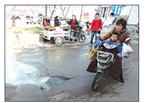
▲居民骑电动车小心翼翼地绕行。

对此,天桥区市政工程管理局排水科一位王姓工作人员表示,这里他们前段时间也去看了,这段污水管道本应该连接到黄岗路底下的主污水管道,但当时黄岗路的施工单位并没有将其连接。“现在施工单位并没有将这段路的相关手续跟我们交接好,我们现在还没有对这块的管理职能。”王姓工作人员说。