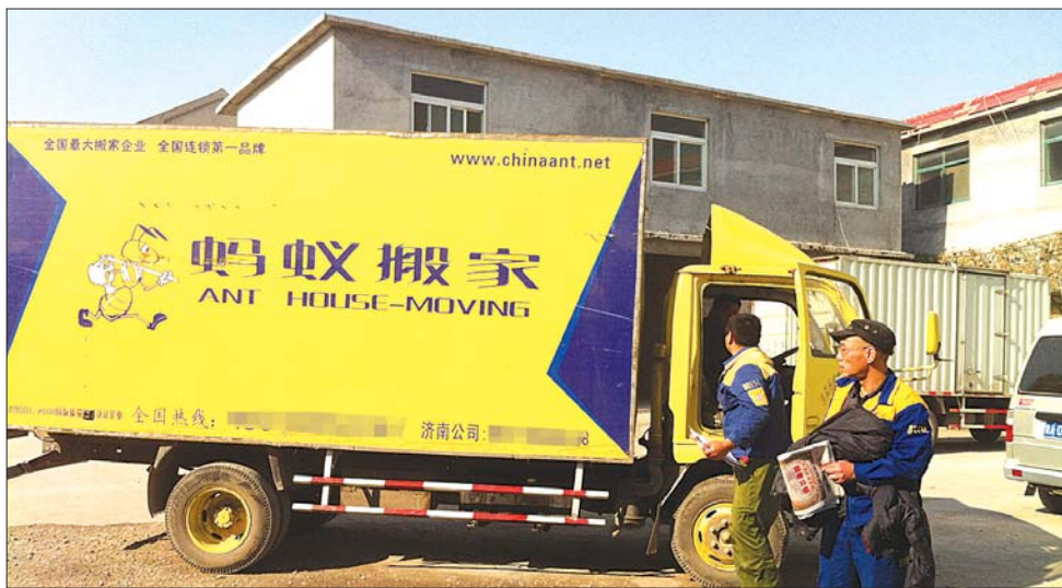
正规“蚂蚁搬家”公司的搬运车辆。

济南大大小小的“蚂蚁搬家”公司30多家,却只有一家进行了商标注册的正规“蚂蚁搬家”公司。15日,位于成都总部的蚂蚁搬家公司,特地来到济南维权,开始用法律武器为蚂蚁搬家公司正名,维护品牌信誉。