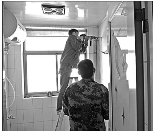
供暖季到了,暖气施工却没完成。

记者从12319了解到,目前,由于改造施工尚未供暖的小区还有一些,主要是由于改造施工的时间安排得太晚,这些小区的居民估计要迟些才能供上暖。