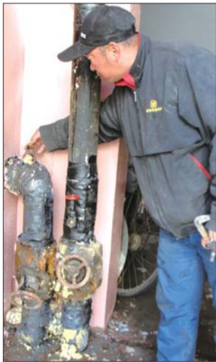
维修人查看漏水暖气管。

“以为单元楼暖气管道漏水,原来是虚惊一场。”王女士说。维修人员告诉记者,供暖初期,维修的工作量骤增,烟台500供热公司问暖电话每天24小时全天值班,维修人员晚上也会轮流值班,只为确保居民能顺利供暖。“一楼住户家漏水管要更换新管,新管更换完成了,马上就可以开总阀恢复供热。”维修人员说。