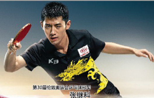
第30届伦敦奥运会乒乓球冠军 张继科