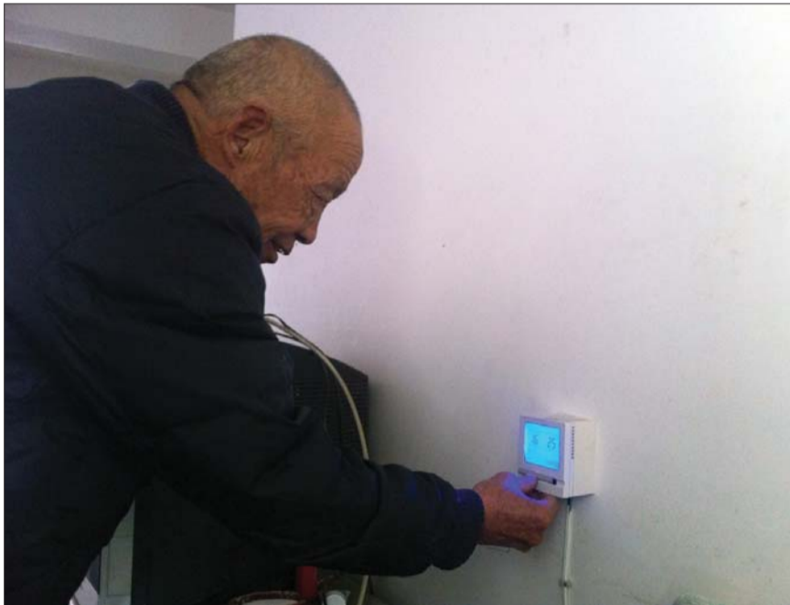
金城小区C区业主只需要打开室内温控器即可供暖。

记者随后在金城小区C区楼道前发现了物业贴出的通知。通知上说小区内安装有暖气计量表系统,并附上了室内温控面板的使用方法。业主需要打开温控器最左边的电源键打开,使显示屏长期处于开启状态,否则阀门处于关闭状态而无法供暖。使用活插头电源的需分清零火线,红色或绿色为火线,黑色或蓝色为零线,需要把右侧显示的温度调高于左侧显示的温度,只有这样室内才会热起来。