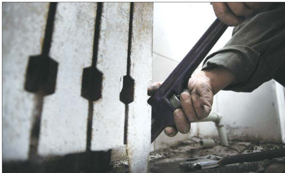
工作人员在修理居民家中暖气片。

18日,住户董先生告诉记者,得知必须先交齐维修费才给维修,16日当晚一位住户就挨家动员,2户居民今年不供暖,其余10户便将720元维修费凑齐了。“晚上热力公司下班了,我们就商量着直接