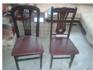
椅子出售,大约60把, 每张椅子48元左右。 电话: 13589854071 13054530581