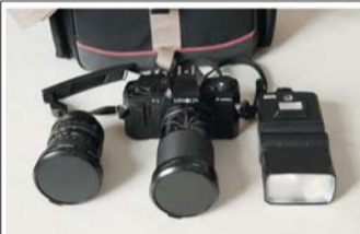
出售美能达专业胶卷相机一套 购于1997年2月 原价12000元 现价3800元 手机: 13906380839