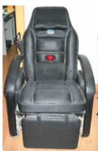
欲售全新 电动按摩椅 一个 联系电话: 15553509526 价格面议