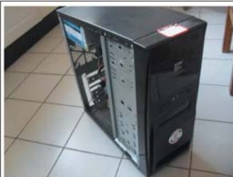
双核CPU 1g内存 160G硬盘 办公家用首选 480元 8成新 电话: 13255536893