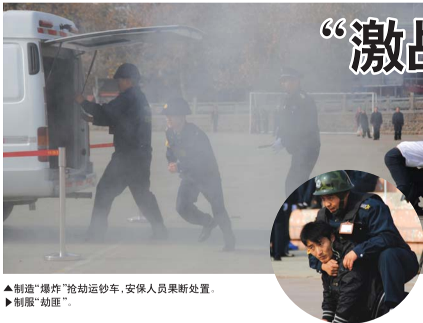
▲制造“爆炸”抢劫运钞车,安保人员果断处置。 ▶制服“劫匪”。

15日中午起,羊毛衫批发市场前不再收费。18日记者再次探访时,现场也没看到收费人员。