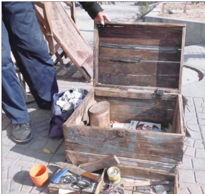
闫先生的老箱子里面装的是他修鞋的工具。

现在,闫先生还在做着修鞋匠的工作,当年的老箱子也一直伴随左右。虽然箱子破了些,人老了些,但每当闫先生看到它,就想到过去,往事又浮上心头。