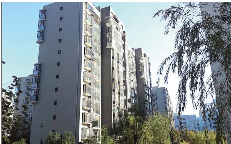
▲锦绣泉城6号楼。

买房时五证俱全,谁料按照合同约定的办理房产证日期过了一年,业主们依然没有拿到房产证。由于开发企业超规划建设,济南华龙路上锦绣泉城小区的三栋楼约300住户办理房产证遇阻。