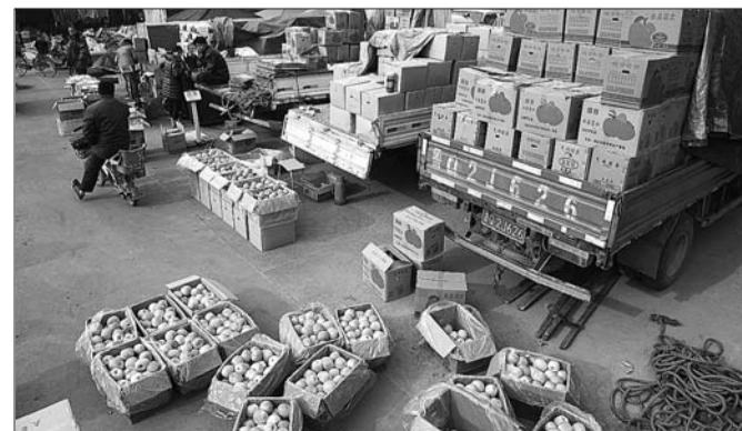
20日,济南堤口果品批发市场里有大量苹果待售。

中国果品流通协会统计,最近两年,50%以上储存了苹果的经销商亏损,每公斤亏损达到1元的比比皆是,有不少经销商难以为继。