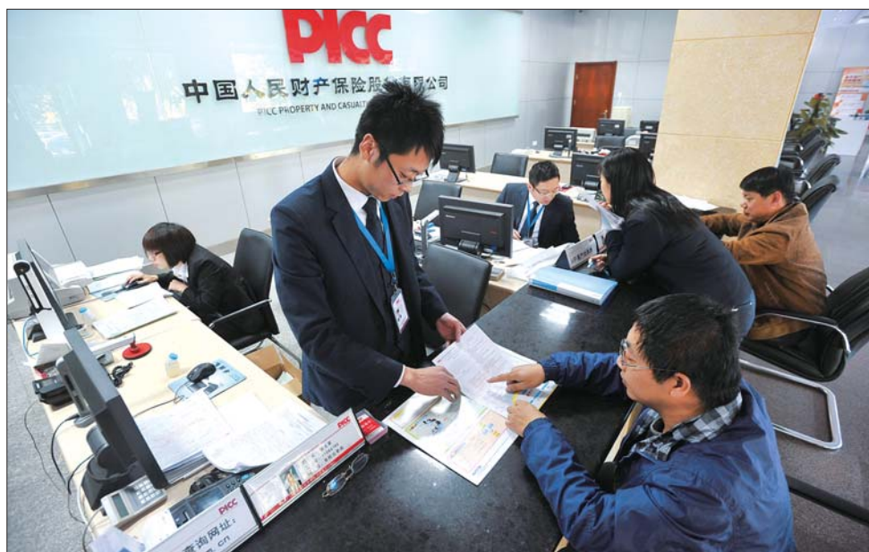
在人保财险服务大厅,几位市民正在咨询和办理业务。

通常情况下,买车险可以指定两名驾驶员。指定驾驶员驾驶车辆出险的话,可以赔偿100%金额;但要是非指定驾驶员驾车出险,核定理赔金额时便会增加10%的绝对免赔率。因而,车主在购买车险时,可以根据自身需要考虑是否要指定驾驶,因为其理赔金额是不同的。另外,喝酒后车主也需要考量一下找人代驾的风险,避免因出险导致理赔不足。