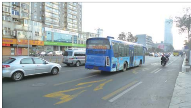
20日早晨,公交车在北马路公交专用道上行驶。