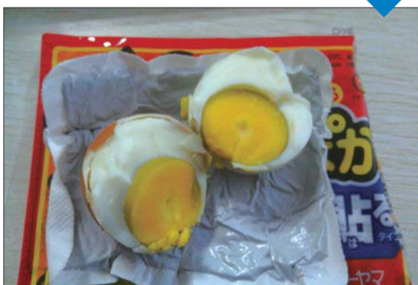
▲三个半小时后,将鸡蛋掰开,蛋黄蛋白完全熟了。