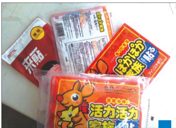
▲记者实验所用的暖宝宝贴,这种暖宝宝贴在市面上大量销售。