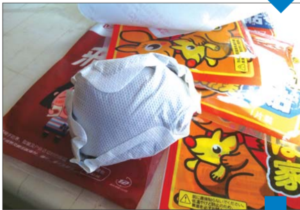
▲取出用两片暖宝宝贴将鸡蛋包裹严实。