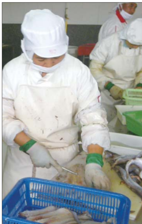
安德水产的工人正在赶一批出口订单。