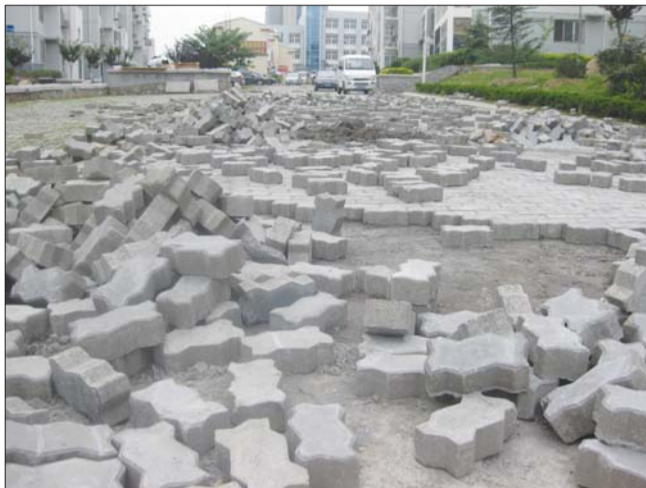
小区居民说,这种路面铺设叫“干铺”,砖块不结实,容易被车压碎。

位于李沧区金水路百通依山小居,车行道上铺的是砖块,居民入住两年半,道路变得千疮百孔,频繁的修补让业主很不满意。2011年7月,在本报连续性的监督报道下,小区道路最后变成沥青路。