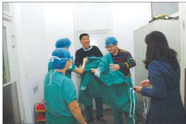
社会监督员穿起手术服体验手术环境。

近几年,青岛市第三人民医院以“医院迁建”为契机,通过加强学科建设,引进高层次人才,缩小南北差距,全面提升医护服务水平。2011年医院成为卫生部在青岛市唯一的全国病理切片远程会诊系统成员单位,2012年医院妇产科成为中国医师协会青岛地区首家妇科内分泌培训基地。妇产科的子宫肌瘤自凝刀射频治疗、内科的心脑血管疾病的诊疗被评为青岛市卫生行业特色专科。同时,医院加大人才引进和培养力度,实施有计划、有步骤地外出进修战略计划。2010年以来,医院引进乳腺外科、肝胆外科、心血管内科、神经内科等专科学科带头人8名,选送外出进修学习人员47人,招聘硕士研究生22人,选送6名业务骨干赴奥地利进行技术培训。新三医启用后,医院将成为功能布局更加合理、诊疗流程更加科学、就医环境更加舒适的三级综合医院。