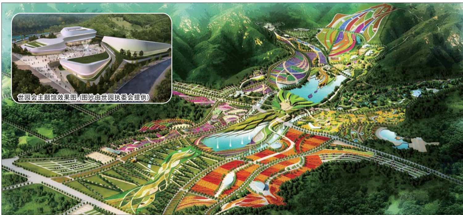
世园会效果图。