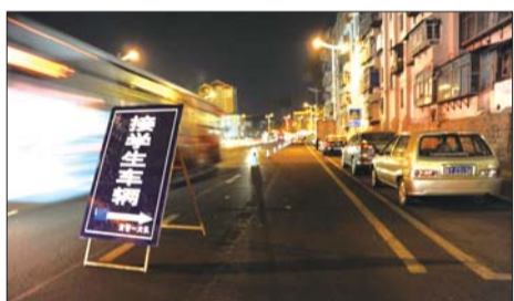
▶21日晚,一中门外,交警在第二条和第三条车道之间安放了隔离桩并摆放了告示牌。

点。但周六晚上住校的学生也要回家,这一下通行压力就上来了。”一中队中队长张震说,三排车道不够用,有时甚至有小车往最中间的车道上停。如此庞大的接学生队伍让现场的执勤民警也颇感无奈。