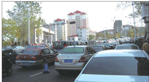
白天,接孩子放学的家长占了两条车道。