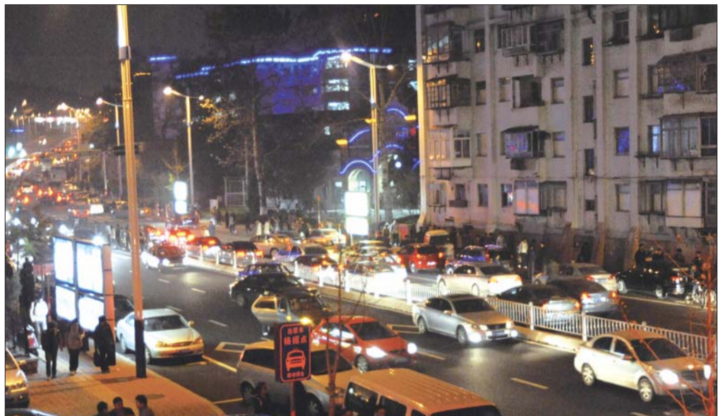
去年11月15日,一中门口挤满了各种车辆。

据介绍,二马路通行压力最大的时候出现在周六晚上,因为此时住校生也要回家。“周六晚上,一中门口路段,向东至东山加油站附近,向西至海军407医院弯道处,一共800多米的路段能停放上千辆车。”交警一大队一中队中队长张震说。