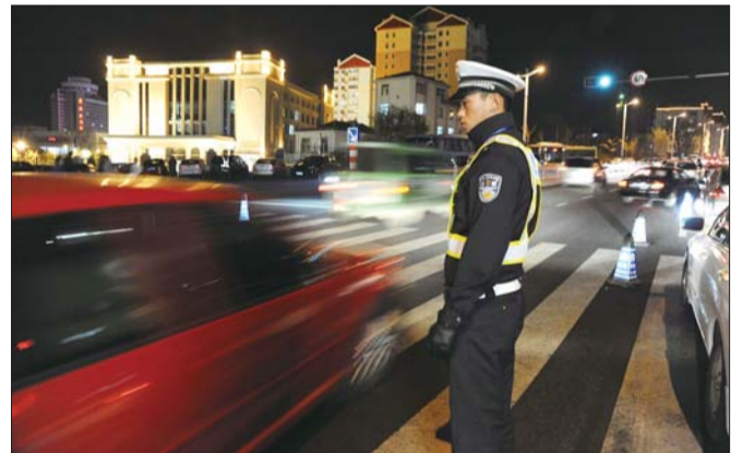
▲21日晚,执勤交警正在一中门前疏导交通。

然而,二马路通行压力最大的时候出现在周六晚上,“平时只是走读的学生回家,来的家长相对少