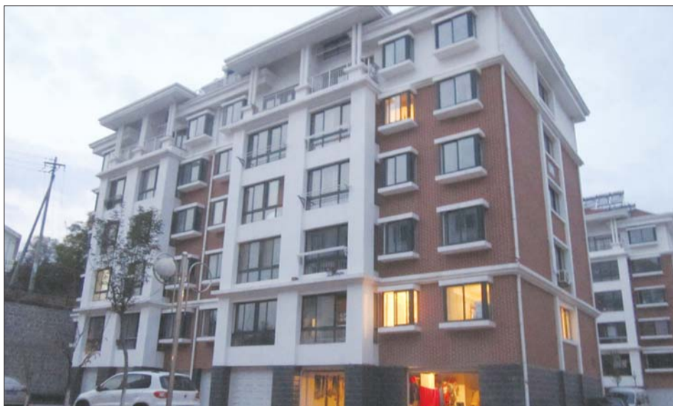
同和馨园居民质疑热计量费用到底该谁交。