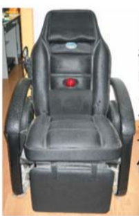
欲售全新 电动按摩椅 一个 联系电话： 15553509526 价格面议