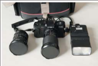
出售美能达专业胶卷相机一套 购于1997年2月 原价12000元 现价3800元 手机：13906380839