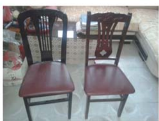
椅子出售，大约60把， 每张椅子48元左右。 电话：13589854071 13054530581