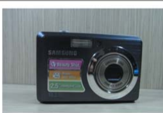
2010年买的三星ES55/SL102普通数码相机 1000万像素 数据线+电池+2G内存卡 500元 电话：18953550226