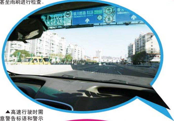
▲高速行驶时需注意警告标语和警示灯,忌乱打远光灯。