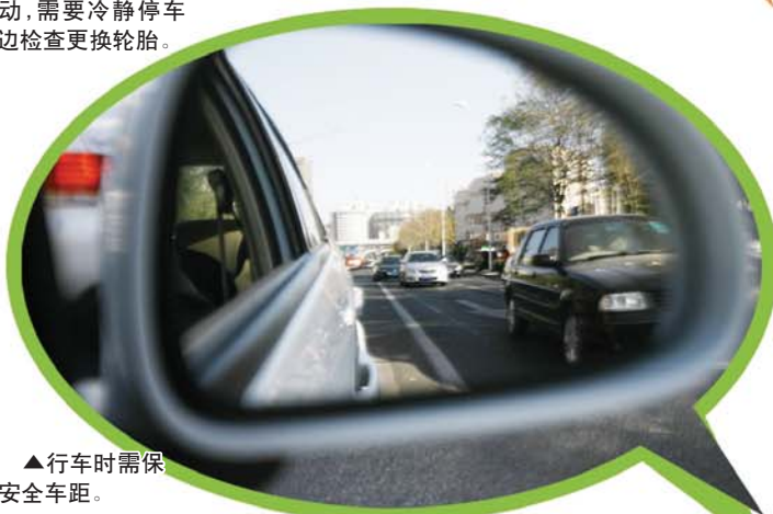
▲行车时需保持安全车距。