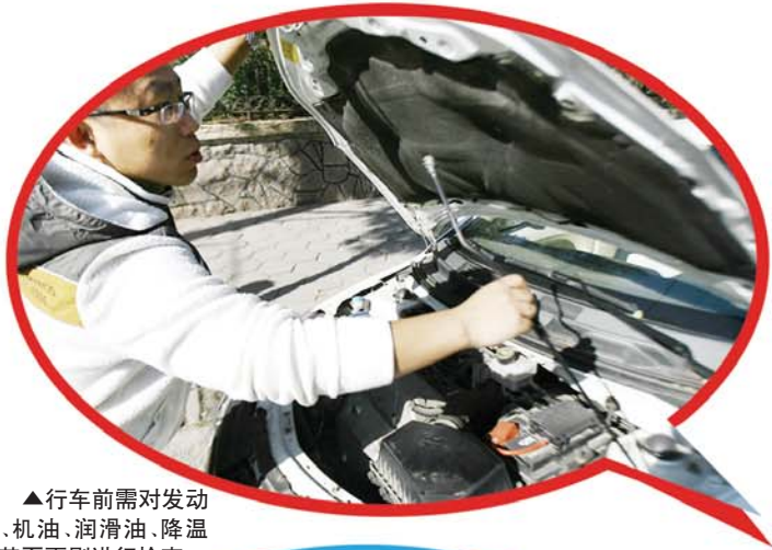
▲行车前需对发动机、机油、润滑油、降温液甚至雨刷进行检查。

提起高速公路上的安全行车,不少老司机可能会不屑一顾。随着机动车的日益普及,越来越多的人能够考取驾照,然后持证上岗。但其中不少人虽然能通过驾考项目,却通不过不了行车中各种突发状况的考验。这一期的“安全行车补习班”,将列举一些在高速公路上行车过程中遇到的突发状况以及容易犯的错误,并提醒司机朋友如何正确处理问题。