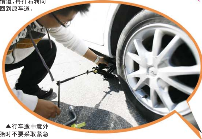
▲行车途中意外爆胎时不要采取紧急制动,需要冷静停车靠边检查更换轮胎。