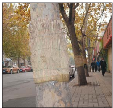
法桐穿上草编的“超短裙”,防治白蛾效果不错。

冬季虽然成虫较为少见,但却是防治美国白蛾的好季节。在人工防治中,一般是刮除主干上带蛹的老树皮,扫除带有卵块的叶子并集中烧毁。另外,老熟幼虫下树化蛹之前,在树干离地面1米高处用稻草、干草或草绳束绑草把,待老熟幼虫化蛹于其中后,解下草把烧毁,也能达到消灭美国白蛾的目的。