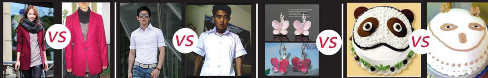
淘宝图：真心欧美大牌范儿！ 实物图：你确定不是店家爸妈当年结婚时穿的？