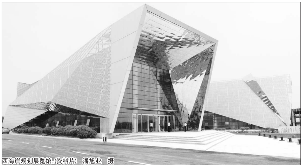
西海岸规划展览馆(资料片)

经审讯,犯罪嫌疑人某某对利用工作之便盗窃公司铝板100余张的犯罪事实供认不讳。今年25岁的某某是滨州人,2009年来到该公司冷轧车间工作。今年11月初,某某按照车间安排开始上夜班,工作期间,趁其他员工不注意,某某就利用工作设备将生产线旁边的铝板压弯,然后用胶带将这些铝板缠到一起,再将铝板扣到身上,用腰带勒紧,然后穿上外套,如果不仔细看外人很难发现。就是利用这种办法,某某先后五次盗窃公司铝板100余张,涉案价值6000余元。目前,某某已被刑事拘留。